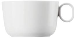
Cup Obertasse Tazza Tasse

14642 Ø 9,5 cm H 5,5 cm 0,23L Ø 3 \frac{3}{4} in. H 2 \frac{1}{3} in. 8 oz.