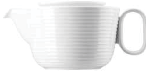
Teapot Teekannel Teiera Théière

14767 Ø 9,5 cm H 6 cm 0,28L Ø 3 \frac{3}{4} in. H 2 \frac{3}{8} in. 9 \frac{7}{8} oz.