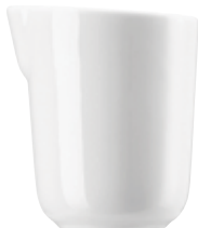
Creamer Milchkännchen Lattiera Crémier

14440 Ø 7 cm H 8,5 cm 0,20L Ø 2 \frac{3}{4} in. H 3 \frac{3}{8} in. 7 oz.