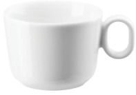
Cup Obertasse Tazza Tasse

14717 Ø 6 cm H 5 cm 0,08L Ø 2 \frac{1}{3} in. H 2 in. 2 \frac{7}{8} oz.