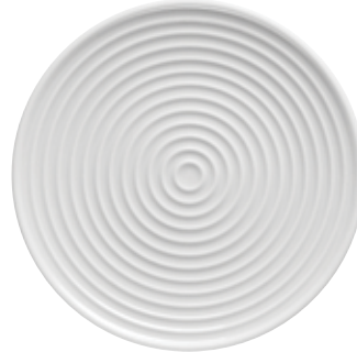
Plate flat / Saucer Teller flach / Untertasse Piatto piano / Piattino Assiette plate / Soucoupe