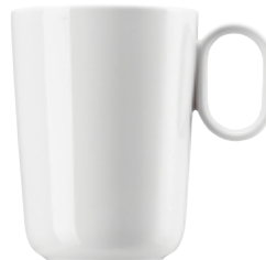
Mug with handle Becher mit Henkel Mug con manico Tasse avec anse

14440 Ø 7 cm H 8,5 cm 0,20L Ø 2 \frac{3}{4} in. H 3 \frac{3}{8} in. 7 oz.